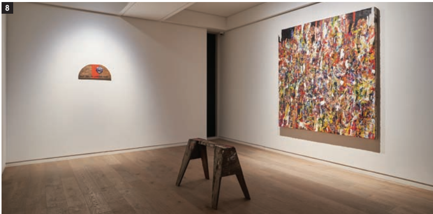
08_09_10_11_ Exhibition view of 'Oliver Arms: Don't Take My Sunshine Away', Jason Haam, Seoul, 2021.